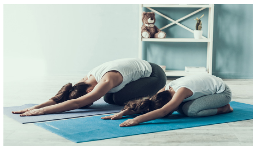
Bien s'étirer à la fin de la journée

Comme vous, et peut-être encore plus, votre enfant ressent le besoin de bouger ! Programmez des pauses régulières, toutes les demi-heures environ, et actives : conseillez à votre enfant de changer de position, de se lever et de marcher pour se dégoûter les jambes et oxygéner son cerveau. Vous pouvez faire ensemble des petits exercices pour vous étirer et vous relaxer, sans oublier les yeux (regarder au loin, cligner des yeux, frotter les paupières...) pour éviter la fatigue visuelle qui peut apparaître lors du travail sur écran.