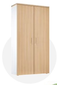
Armoire   portes battantes