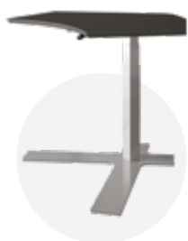
Espace de travail collaboratif