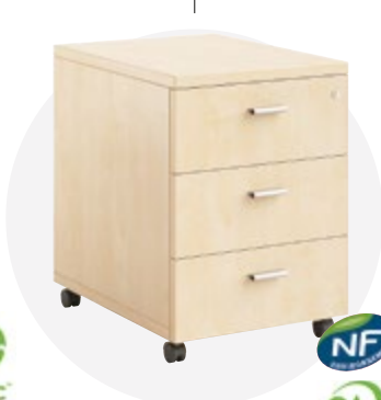
Caisson mobile 3 tiroirs