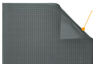
Version basic à bulles