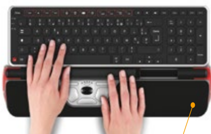
Utilisation avec RollerMouse Red

Le clavier Contour apporte un confort de frappe optimal avec des touches souples et silencieuses. Spécialement conçu pour s'associer avec les RollerMouse, il offre une grande proximité entre la barre de contrôle et les touches du clavier, réduisant ainsi les mouvements effectués entre ceux-ci. La finition mate limite l'effet de brillance et réduit ainsi la fatigue visuelle.