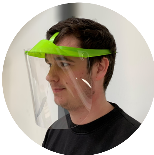
Écran de protection individuel