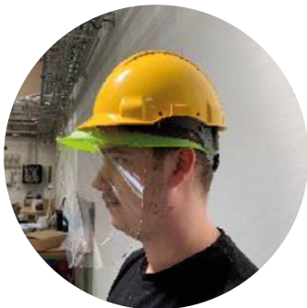
Compatibilité avec casque de chantier