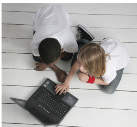
Attention aux mauvaises postures prolongées devant l'ordinateur...

L'utilisation d'un ordinateur est de plus en plus demandée pour différents travaux à l'école ou pour les devoirs à la maison. En effet, afin de garder le lien avec leurs élèves et guider les parents pendant le confinement, les enseignants proposent toutes les semaines du contenu éducatif via des plateformes spécialisées ou envoient des exercices par mail.