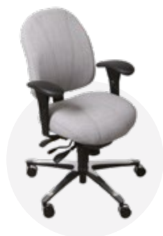
Dossier medium (HD)