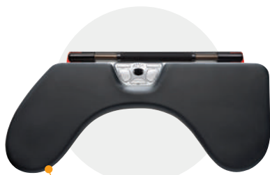
Repose-bras Red adaptable au RollerMouse Red/Red Plus > p 82