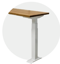
Extension 3ème pied (en option)