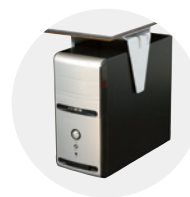
Support d'unité centrale Anyway

Nos mobiliers sont personnalisables à volonté : contactez-nous pour trouver la solution la plus adaptée à votre cahier des charges.