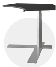
Espace de travail collaboratif