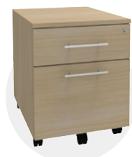
Caissons mobiles 2 ou 3 tiroirs