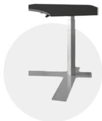
Espace de travail collaboratif