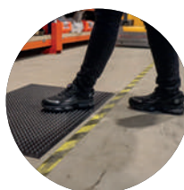
Résistant aux produits chimiques et à l'huile