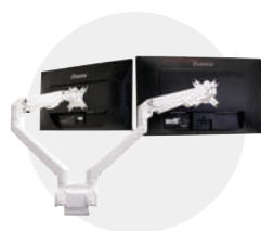
Version double écran