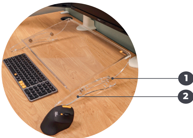
1 Vis d'assemblage