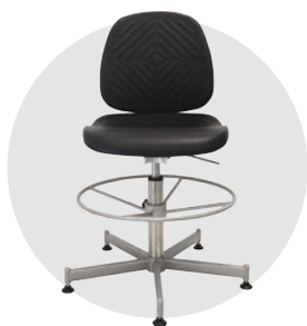
Platinox (assise plate)

Ce mode d'emploi est utilisable pour les sièges Platinox et Sellinox de la marque ErgoExpert