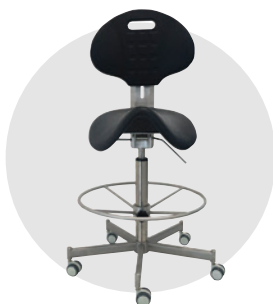
Sellinox (assise selle)