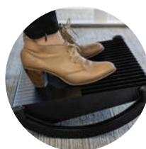
Mode d'utilisation dynamique

Léger mais très robuste, le repose-pieds Dopio offre deux modes d'utilisation différents : soit avec sa face plate au sol, pour garantir un appui stable et une posture équilibrée au poste de travail, soit sur sa face semi-circulaire pour stimuler la circulation sanguine au niveau des membres inférieurs, dans une posture plus dynamique. Son plateau est alors inclinable de -50^{\circ} à +50^{\circ} . Il dispose de bandes et patins en caoutchouc lui conférant une bonne adhérence au sol lors de l'utilisation.