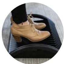
Mode d'utilisation statique