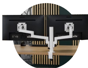
Version double écrans