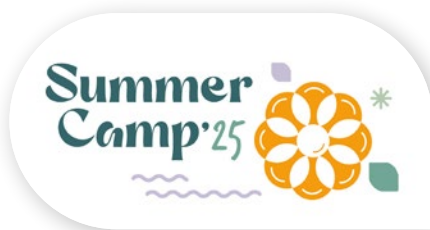
Séminaire estival 2025

Des actions de partage, comme les teambuilding ou les séminaires sont très régulièrement mises en place pour réunir les équipes réparties dans toute la France.