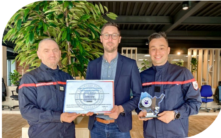
Cérémonie de remise du label en 2024

Depuis 2024, Azergo fait partie de ce réseau, affirmant ainsi son engagement en faveur d'une économie plus solidaire et responsable.